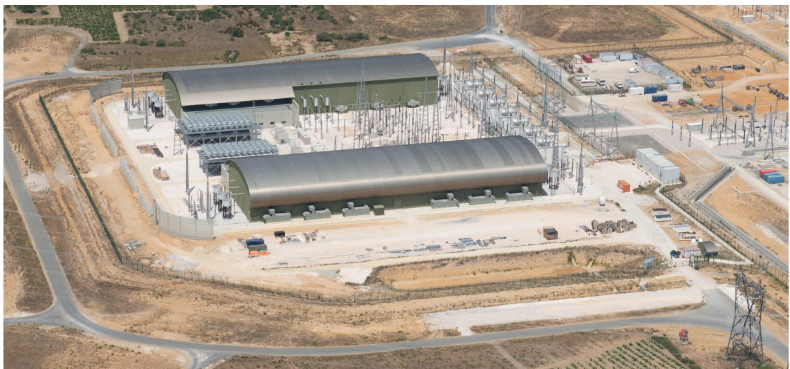
Estación conversora de Baixas

Para todo ello, Inelfe ha escogido la tecnología más avanzada que existe en la actualidad y que ya supone un foco de atracción para numerosos expertos de todo el mundo, por las ventajas que comporta para la gestión de la red eléctrica.